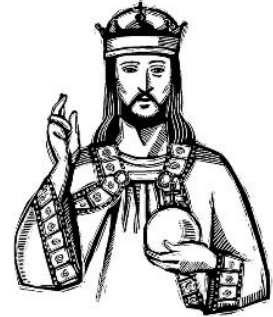
CRISTO EL REY

Cuando llegaron al lugar llamado la Calavera, lo crucificaron allí, junto con los criminales, uno a su derecha y otro a su izquierda. Lucas 23:33 (NVI)